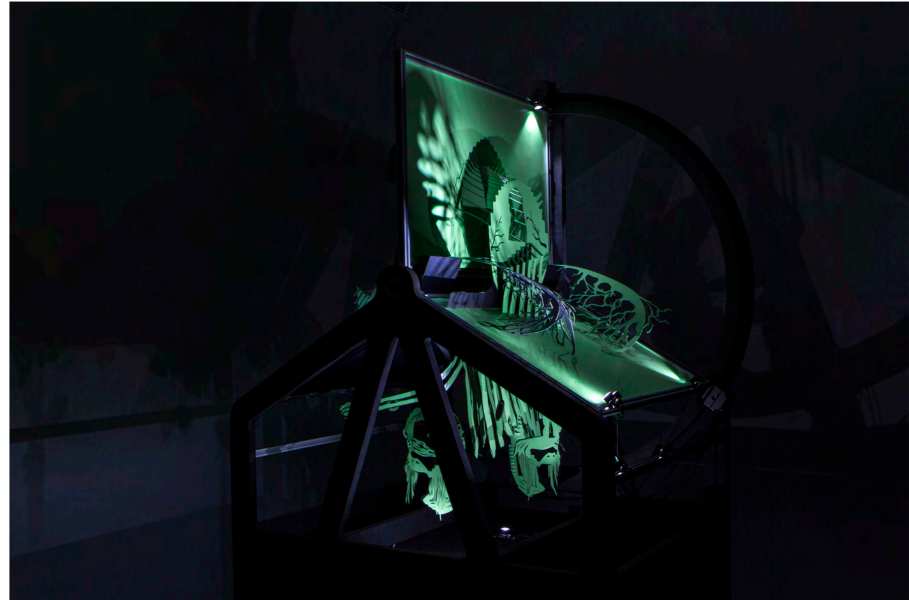
Yuki Onna is the Ghost in the Machine , 2016

העבודה היא מכונה שמציגה מחזה בשלוש מערכות המופיעות סימולטנית על במות נפרדות, ומקפלות בתוכן את סיפור העלילה של יוקי אוֹנָה. הן הבמות